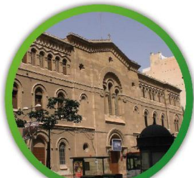
Entrada y salida por calle Terriza